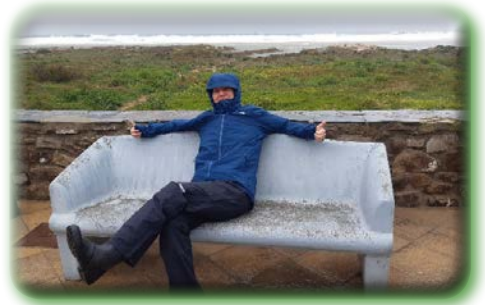
Häufig getragen - Regenklamotten und Gummistiefel