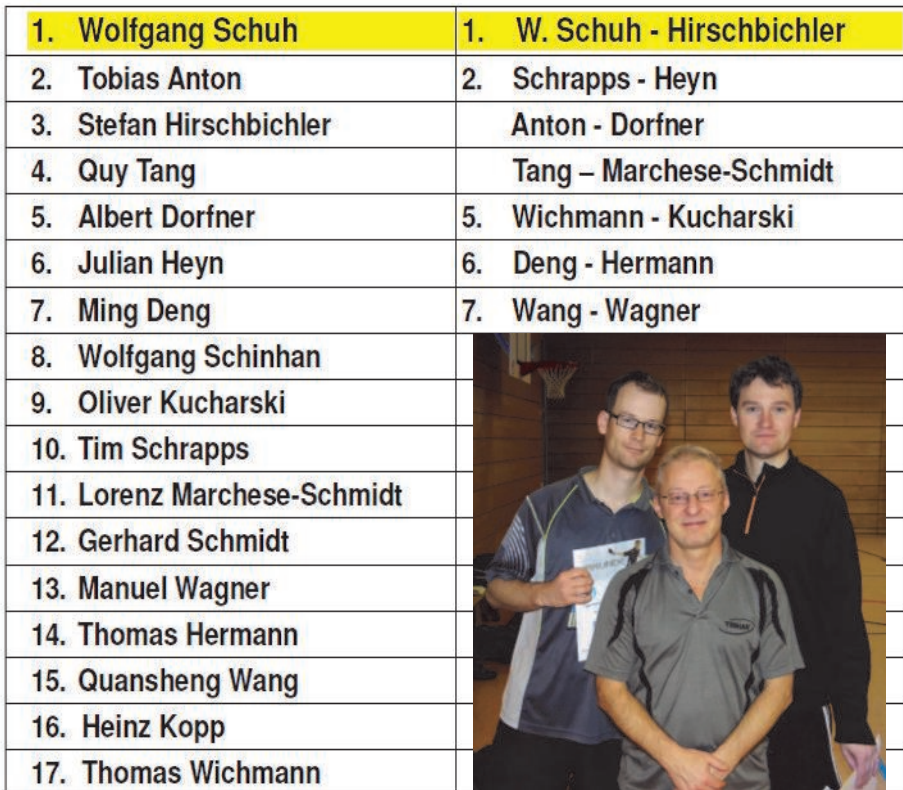
Sieger des RLT-Turniers