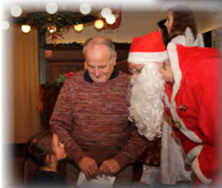
...auch Opa musste mit zum Nikolaus...