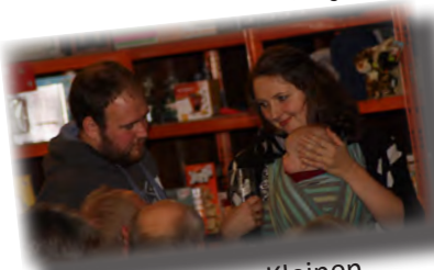
...für die ganz Kleinen ...es war eine Feier für die ganze Familie