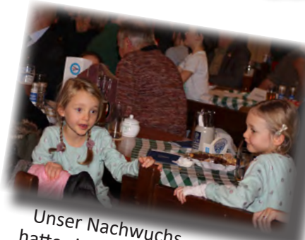
Unser Nachwuchs hatte sichtlich Spaß