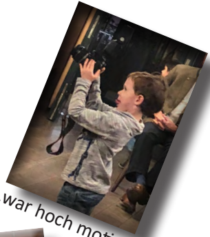
...war hoch motiviert