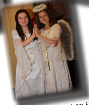
...und unsere 2 hübschen Engerl waren auch wieder da