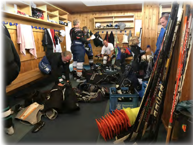
In der Kabine das übliche Chaos