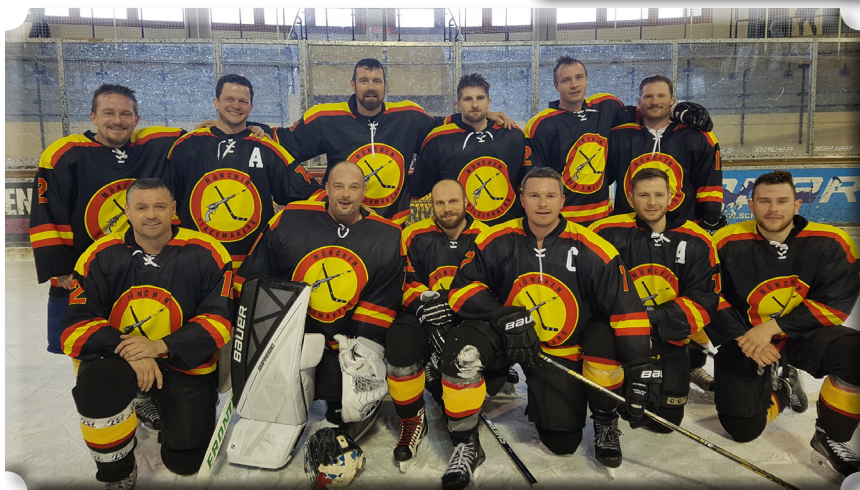
Peacemakers München, 3. Platz beim DPEC 2018