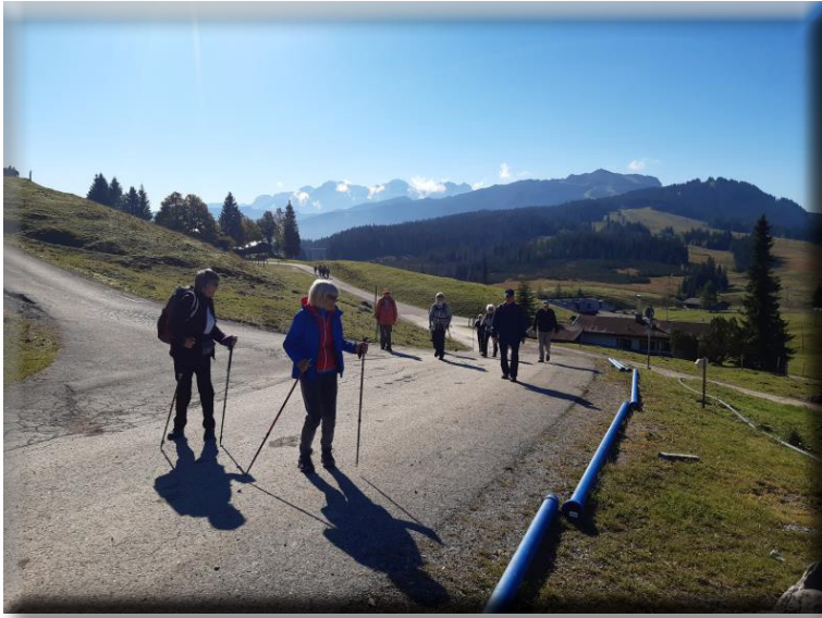
Kaiserwetter – auch wenns a bissl frisch war