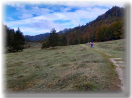
War wirklich kaum was los hier.