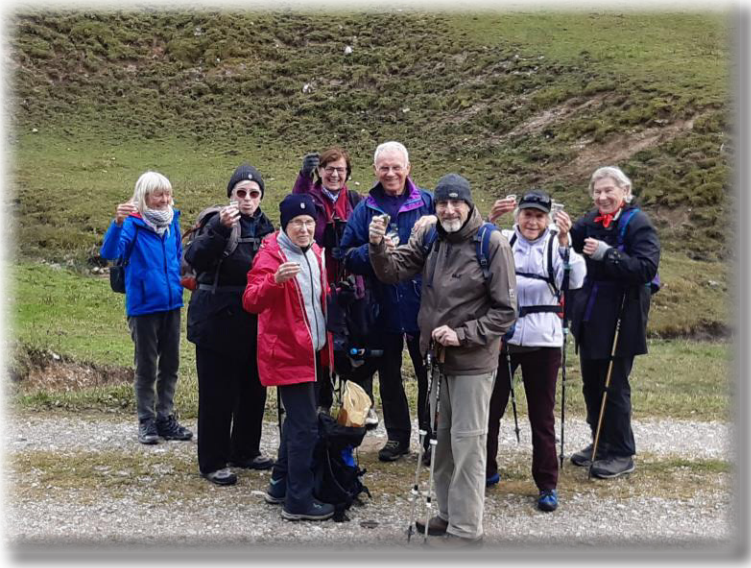
Die obligatorische "Aufwärmphase" - Prost

Am Samstag fahren wir dann bei Kaiserwetter wieder mit dem Bus rauf zur Winklmoosalm – da war dann scho mehra los.