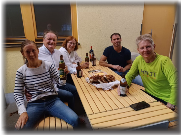
Do sitzen die, die immer do sitzen

Die Brotzeit danach ist obligatorisch – oder, der wahre Grund um ins Training zu kommen!?