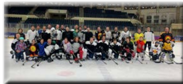
Mannschaft Saison 2022/23

Und damit ist auch gleich das Wichtigste erwähnt! Unsere Mannschaft wächst besonders im jüngeren Bereich! Vom Kindergartenalter bis zum Pensionär ist alles vertreten. So kann's weiter gehen. Und vor allem macht's super viel Spaß!