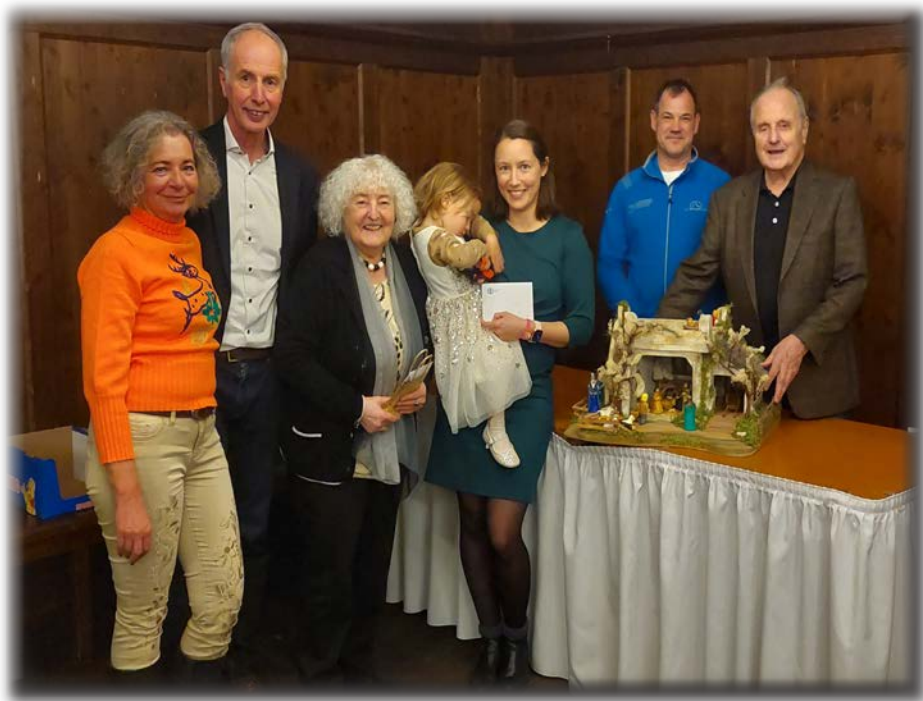
Die Gewinner der Hauptpreise unserer SVF-Tombola gemeinsam mit dem Vorstand

Die Vorstandschaft bedankt sich noch einmal bei den zahlreichen Spendern und Helfern dieser Weihnachtsfeier, insbesondere beim Aufbauteam, denn ohne deren Unterstützung hätte die Jahresabschlussfeier in diesem Umfang nicht durchgeführt werden können.