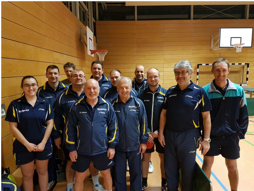
Im Bild die vierte und fünfte Mannschaft beim Derby