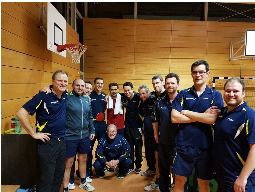
Die zweite und dritte Mannschaft beim Derby